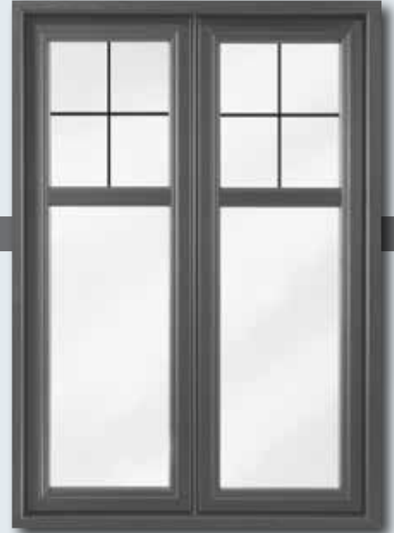
Duo Plus 5 1/2